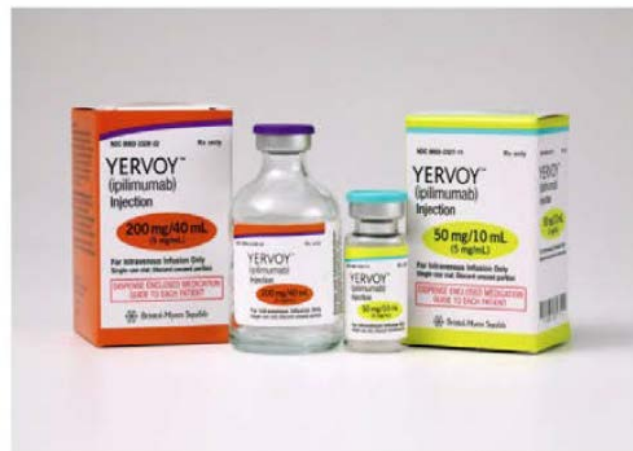
The drug, Yervoy, was developed by Bristol-Myers Squibb, and is a novel type of cancer drug that works by unleashing the body's own immune system to fight a tumor. Bristol-Myers Squibb